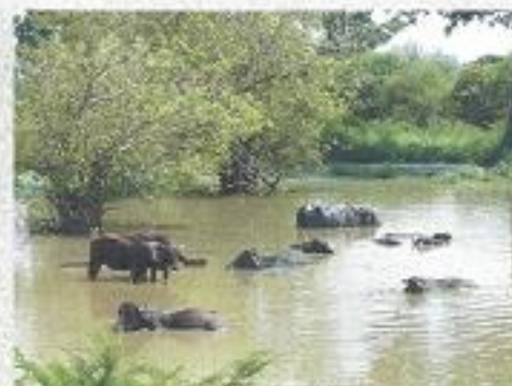
Im Nationalpark Uda Walawa (2011)